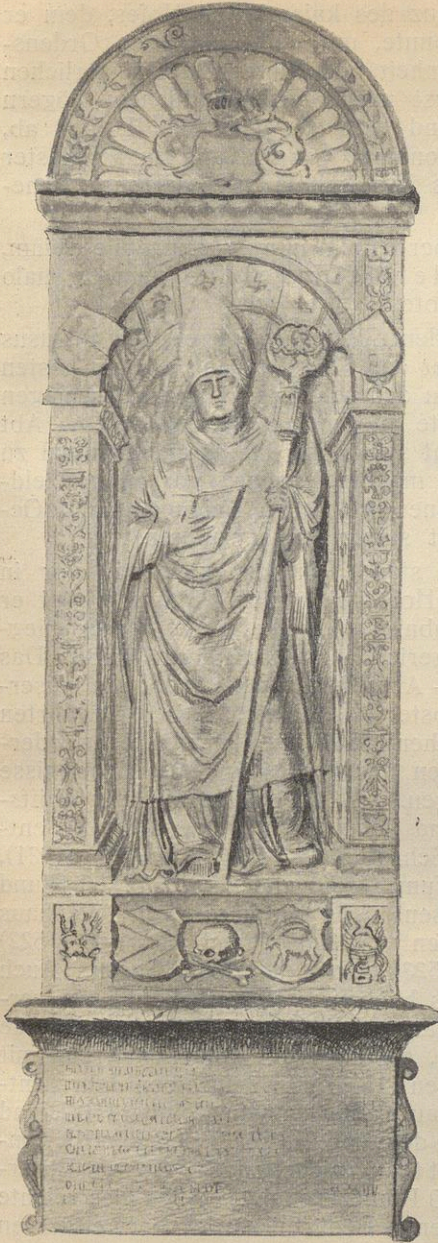
Epitaphium des Abtes Ulrich Pfinzing.

Ulrich Pfinzings Lebensgang beweist, daß ihm von vornherein jede Neigung zum geistlichen Berufe, aber auch jede vorbereitende Erziehung dazu fehlte. Der ärgerniserregende Wandel eines großen Teiles des Welt- und Ordensklerus seiner Zeit war nicht geeignet, die Liebe zum Berufe in ihm zu wecken, wohl aber mochten ihn die häufigen Uebertragungen hoher geistlicher Würden an Hoch- und Höchstgeborne locken. Mit der Betätigung echt religiösen Sinnes, der Uebung wahrer Frömmigkeit, mit der gewissenhaften Ausübung des geistlichen Berufes überhaupt nahm man es in jenen Zeiten der Entartung nicht genau, die Verwaltung kirchlicher Aemter war vielfach zum bequemen Mittel schnöden Gewinnes herabgesunken. So hielt auch Ulrich Pfinzing als echter Renaissancemensch ein ungebundenes, freies Leben mit der Abtwürde — war er doch als Laie bereits Propst zu St. Alban in Mainz und Pfarrer zu Weißkirchen in Steiermark — sehr wohl vereinbar, ja letztere sollte ihm die Mittel zu ersterem verschaffen. Bei der rein materiellen Auffassung des geistlichen Berufes nimmt es uns nicht wunder, daß Abt Ulrich sich lange nicht entschließen konnte, die vom Kapitel gestellten Bedingun-