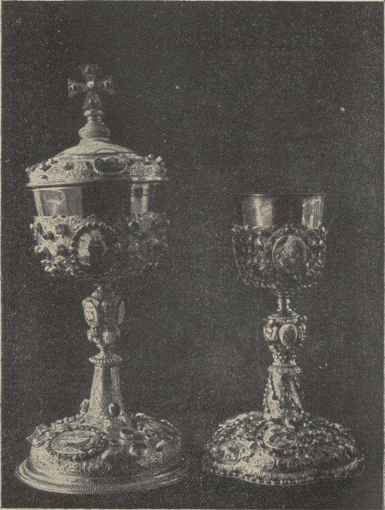
Ciborium und Kelch im Stifte Lambach.