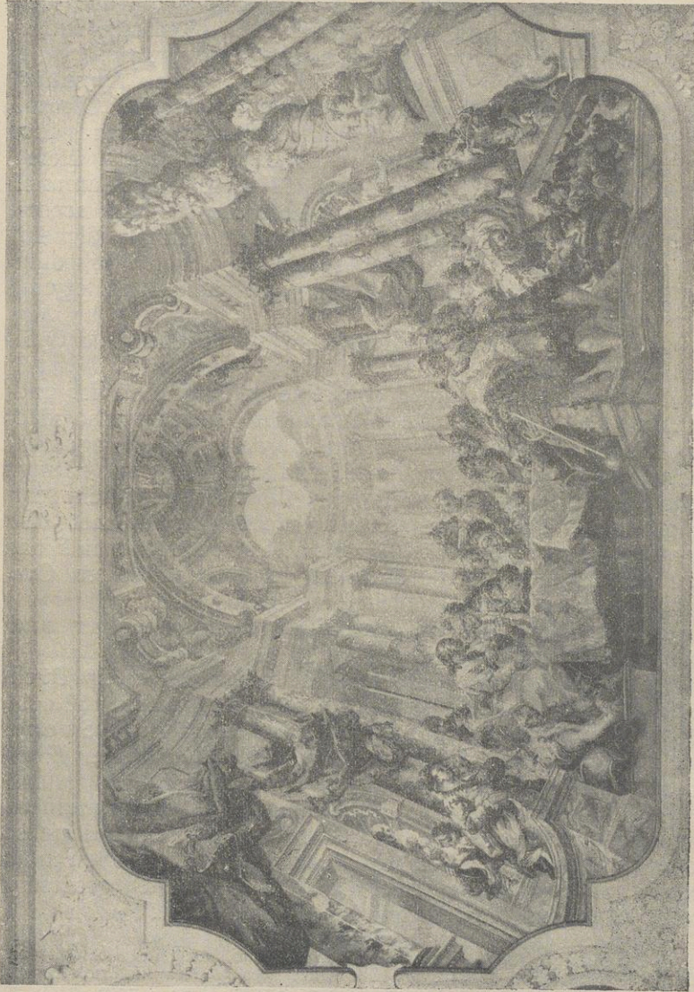
Ein Deckengemälde im Refektorium zu Lambach. (Siehe Seite 415.)