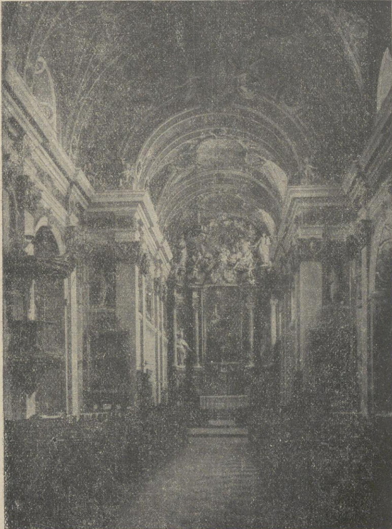
Inneres der Stiftskirche in Lambach. (Siehe S. 382.)