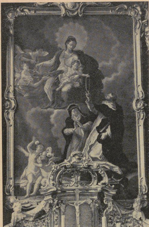
Die Überreichung des Rosenkranzes an den hl. Dominikus Altarbild von Fr. Sebastian Zobl OSB in der Klosterkirche Attel

Die Überlassung der Klischees zu dieser und umseitigen Abbildung wird dem Verlag Schnell & Steiner verdankt.