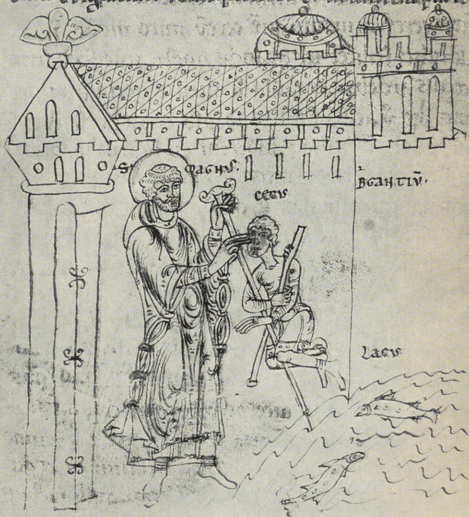
St. Magnus und der Blinde in Bregenz am Bodensee

oratione miserunt eum in hospiciū suū tribuen- tes ei quic poterant necessaria et conuiuatore eligentes. Sicq̄ p̄fatus p̄br̄ p̄noctans eum eis. orō mane orantes corā sepulchro beati galli et benedicentes dñm atq̄ uale dicentes fr̄ib; qui ibi erant. simul p̄fecti sunt deripientes uer̄ uer̄a la- cum brigantur̄ relinquentes eū in sinistra parte