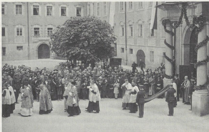
Festprozession anlässlich der Weihe des Kollegs St. Benedikt am 1. Mai 1926 (im Torbogen Dr. Ignaz Seipel, in der Mitte, segnend, Erzbischof Ignaz Rieder)