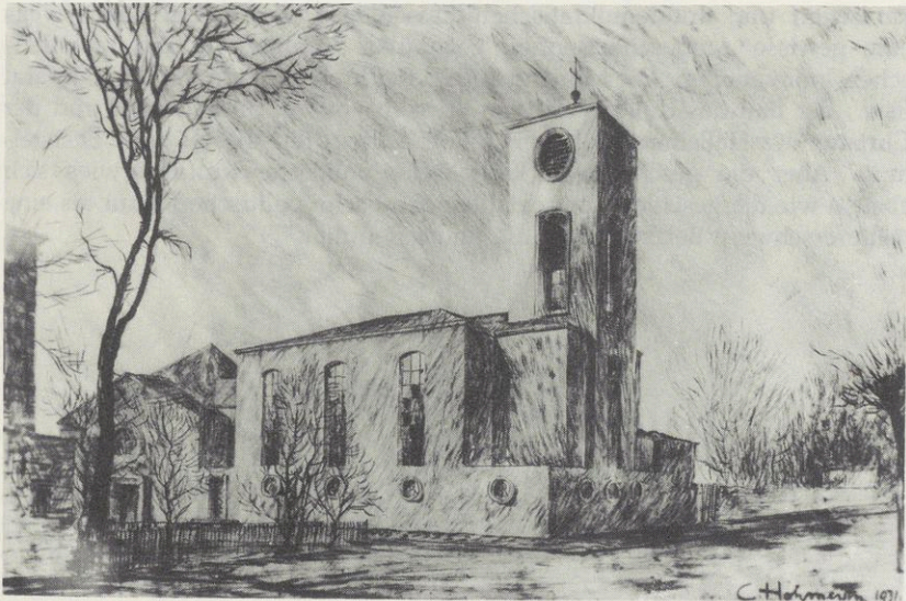
Pfarrkirche Dornbach (Wien XVII.) Neubauprojekt von Arch. Clemens Holzmeister, 1931

Bis weit in die dreißiger Jahre dauerte die Sanierung, die der Erzabtei einen wesentlichen künstlerischen Substanzverlust zufügte, aber ihr Überleben sicherstellte. Im Herbst 1934 brachte dann das Generalkapitel eine wesentliche finanzielle Entlastung: auf Wunsch des Papstes mußten die übrigen Klöster der Konföderation einen Teil der Schulden des Kollegbaues übernehmen 100 .