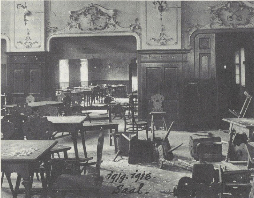
Der große Saal im Peterskeller nach der Plünderung am 19. 9. 1918

alte Zeit noch in vielen Bereichen dominierte, wenn auch in andauerndem Konflikt mit der kapitalistischen Zeitmessung.