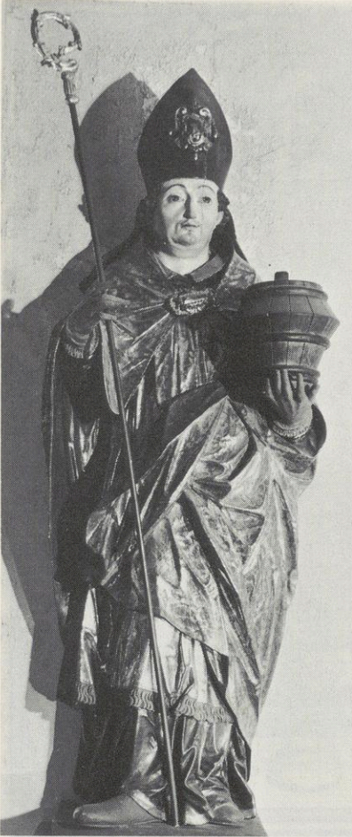
Abb. 96 Hans Waldburger: Hl. Benedikt (ehem. hl. Leonhard)