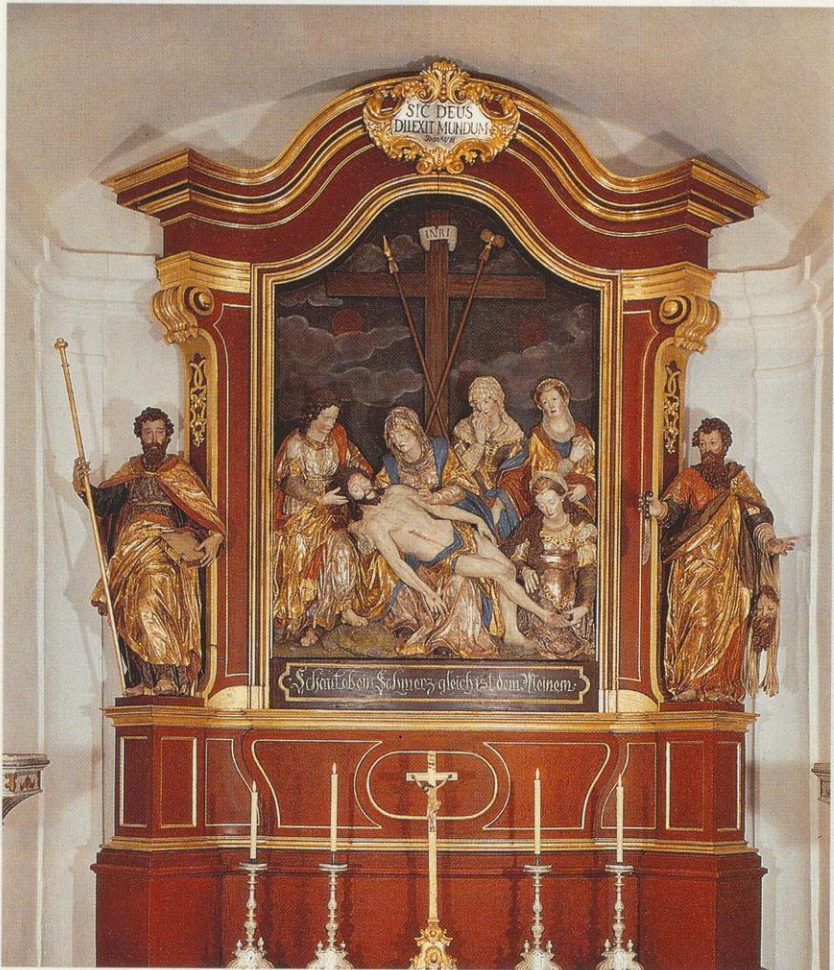
Abb. 100 Hans Waldburger: Relief und flankierende Figuren des ehem. Bartholomäus-Altars von St. Peter. Annaberg, Friedhofskapelle