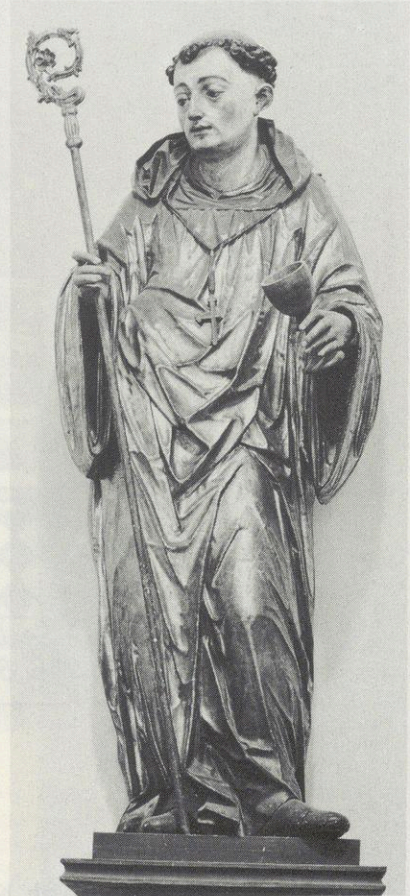
Abb. 97 Hans Waldburger: Hl. Rupert (ehem. hl. Wolfgang)