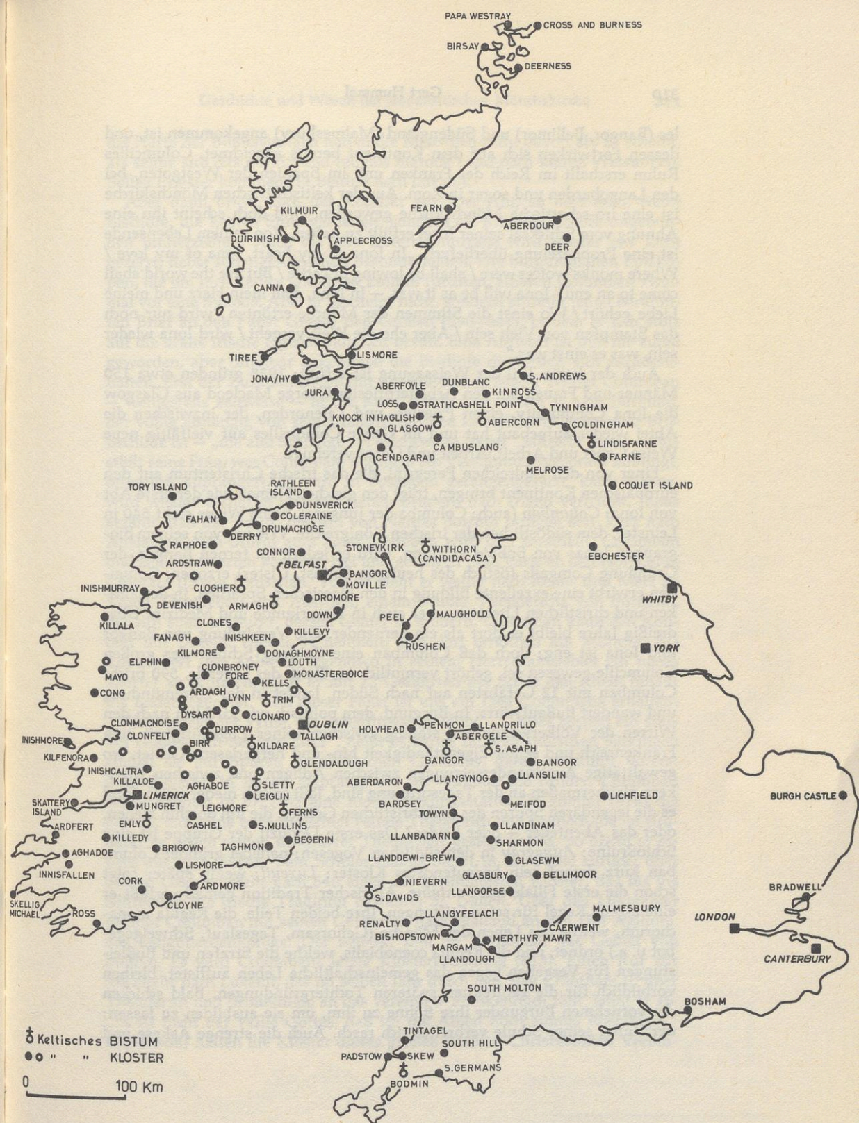
Die Hauptverbreitungsgebiete der Irischen Kirche auf den Britischen Inseln.