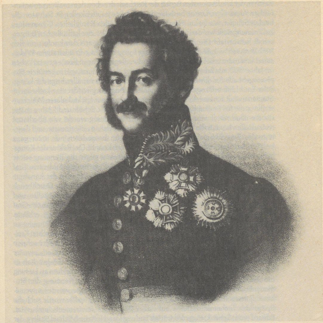
Fürst Ludwig von Oettingen-Wallerstein, Lithographie aus der Zeit der Gründung der Abtei St. Stephan, Fürstl. Oettingen Wallersteinsche Sammlungen, Schloß Harburg.