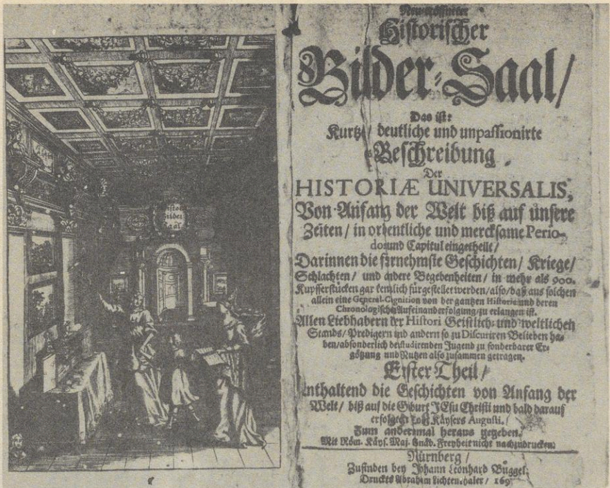
Abb. 4: „Neu-eröffneter Historischer Bilder-Saal [. . .]“, 1. Teil, Nürnberg 169[7], Titelblatt. Linz/D., Bibliothek des ö. Landesmuseums, Sign. I 3516