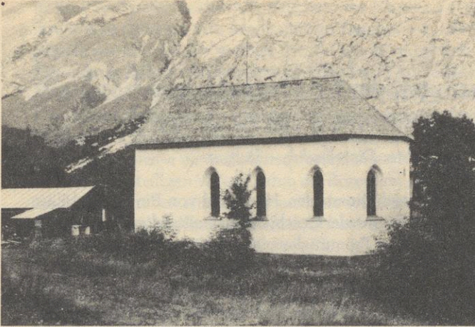
Kapelle des ehemaligen Waldschwesterklosters im Halltal bei Innsbruck (vollendet 1486)

Grabstein des Johannes von Gelnhausen im Kreuzgang des ehemaligen Zisterzienserstiftes Maulbronn. Die linke Hälfte des Grabsteines fehlt, kann aber anhand von alten Abschriften ergänzt werden. (Ergänzung in Klammern)