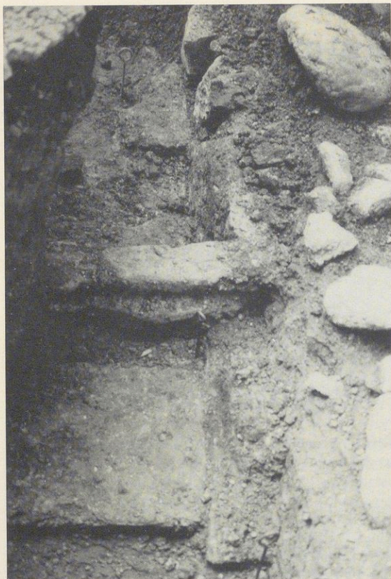
Abbildung Nr. 3 – Kloster Benediktbeuern Reste der dreischichtigen Grablege direkt neben der schräg verlaufenden Grundmauer der ersten Klosterkirche aus dem 8. Jahrhundert. Zu unterst die Reste des Tuffplattengrabes aus dem 8. Jahrhundert (Dr. Stefan Winghart). Darüber der Rest des Mauerkranzes von der 2. Grablege; entdeckt im Herbst 1988.