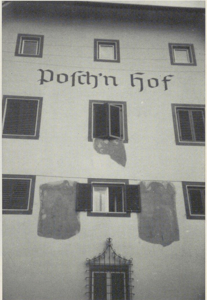
Abbildung Nr. 13 Posch'n Hof in Untermais bei Meran. Vordere Stirnseite; die Freskenreste zeigen die Heiligen Benedikt, Scholastika und Anastasia