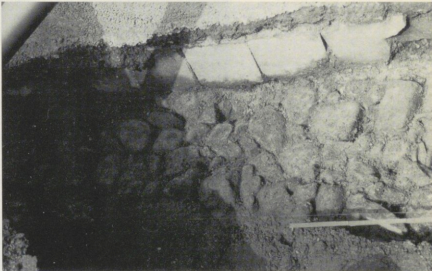
Abbildung Nr. 2 – Kloster Benediktbeuern Die breite Grundmauer der ersten Klosterkirche aus dem 8. Jahrhundert in der Nordostecke des Kreuzgartens, direkt neben der jetzigen Südwand der Kirche aber in schräger, südöstlicher Richtung; entdeckt Anfang September 1988. Unmittelbar neben ihr in gleicher Schrägrichtung wurde die dreischichtige Grablege gefunden, dessen unterste Ebene Reste eines Tuffplattengrabes enthält (Dr. Stefan Winghart).