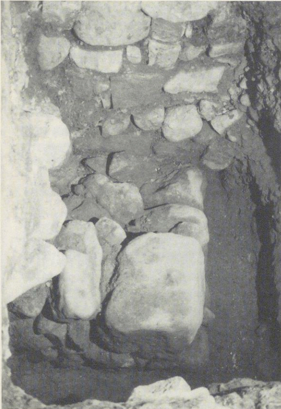
Abbildung Nr. 6 – Kloster Benediktbeuern Nördliches Ende des Kreuzgangs-Ost. Östliche Stirnseite der ersten Klosterkirche aus dem 8. Jahrhundert; Abwinkelung nach Nor- den. Der mächtige Eckstein fällt auf; entdeckt im Frühjahr 1989.