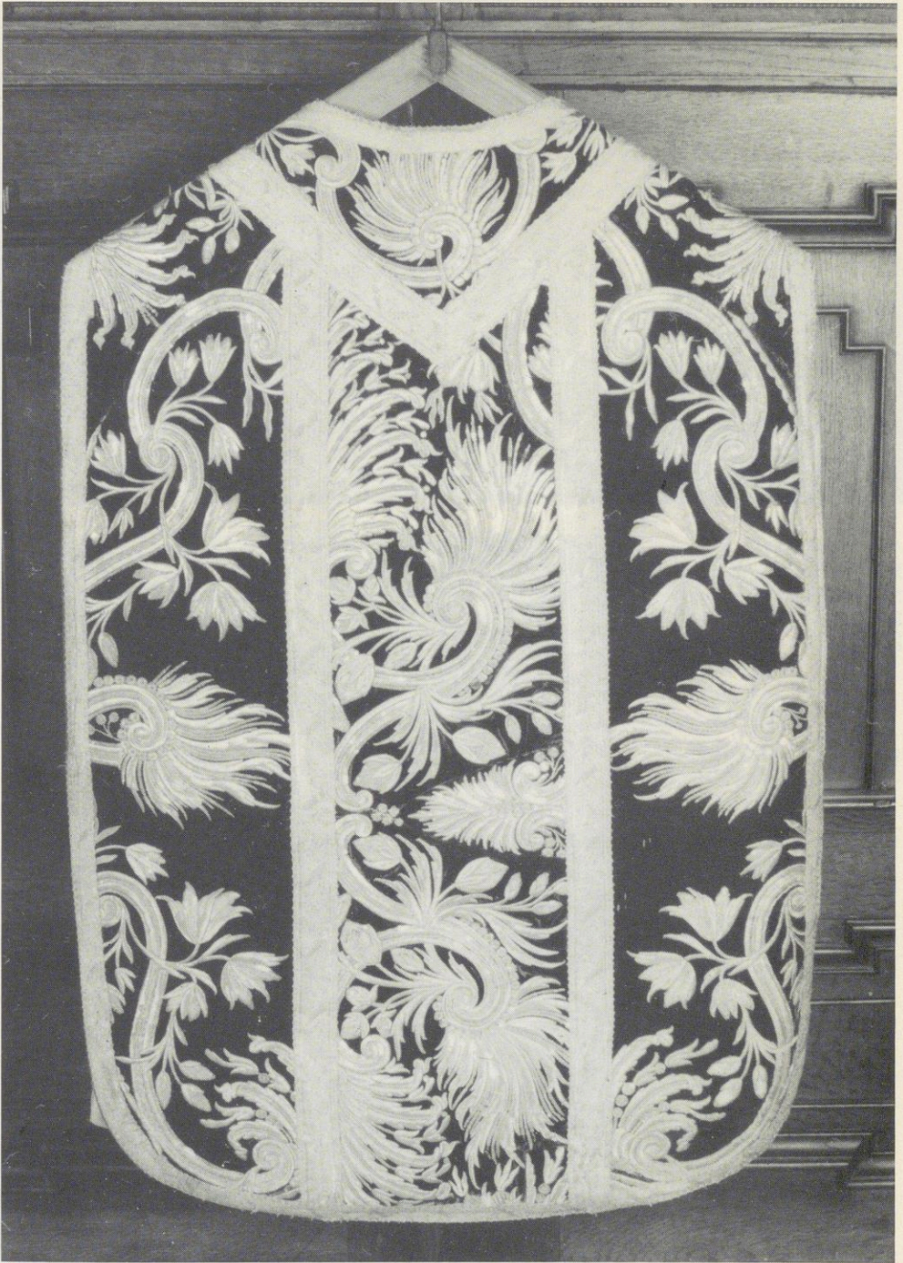
Abbildung Nr. 11 Barockes Meßgewand, Silberstickerei, 18. Jahrhundert; Pfarrkirche St. Benedikt Benediktbeuern; ehemalige Klosterkirche