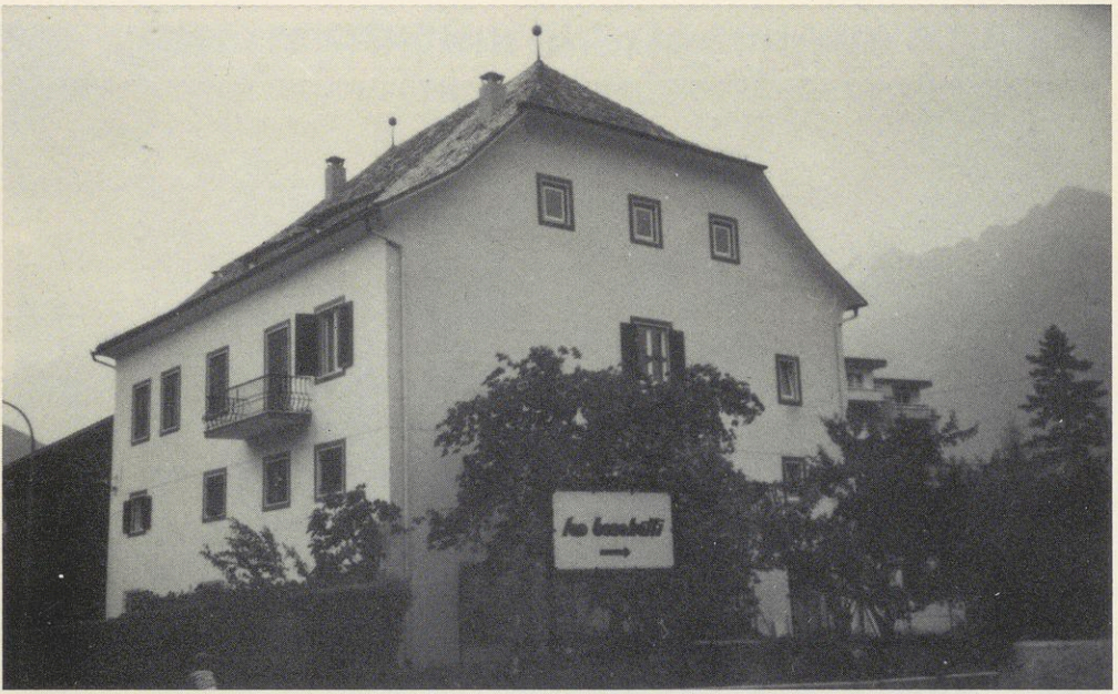
Abbildung Nr. 12 Posch'n Hof in Untermais bei Meran, ehemaliger Weinberg- hof des Klosters Benedikt- beuern