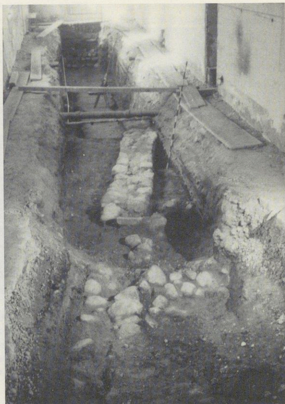
Abbildung Nr. 4 – Kloster Benediktbeuern Kreuzgang-Ost; die westliche Nord-Süd- Grundmauer des Ostflügels des ersten Kloster- baus aus dem 8. Jahrhundert; sie verläuft schräg zum jetzigen Bau; in der Mitte die Abwin- kelung nach Osten, wo sie im Bereich des jetzigen Kapitelsaales auf die östliche Nord-Süd- Grundmauer stößt (Dr. Stefan Winghart) ent- deckt, im Frühjahr 1989.