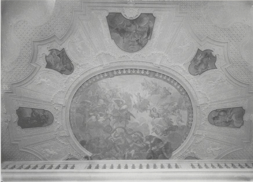
Abb. 3: Ebrach, ehem. Konventbau, Treppenhaus, Deckenbild