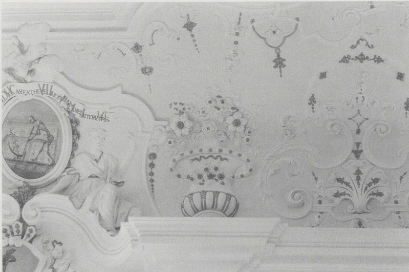
Abb. 8: Bronnbach, Sommersaal, Chronostichon auf den Tod des abtes Josef Hartmann