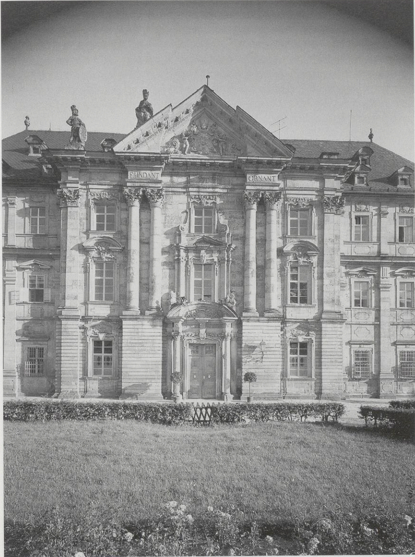
Abb. 1: Ebrach, ehem. Konventbau, Treppenhausrisalit