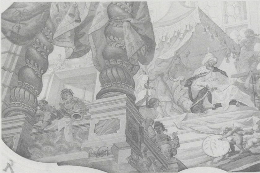
Abb. 12: Bronnbach, Sommersaal, Deckenbild, Ausschnitt