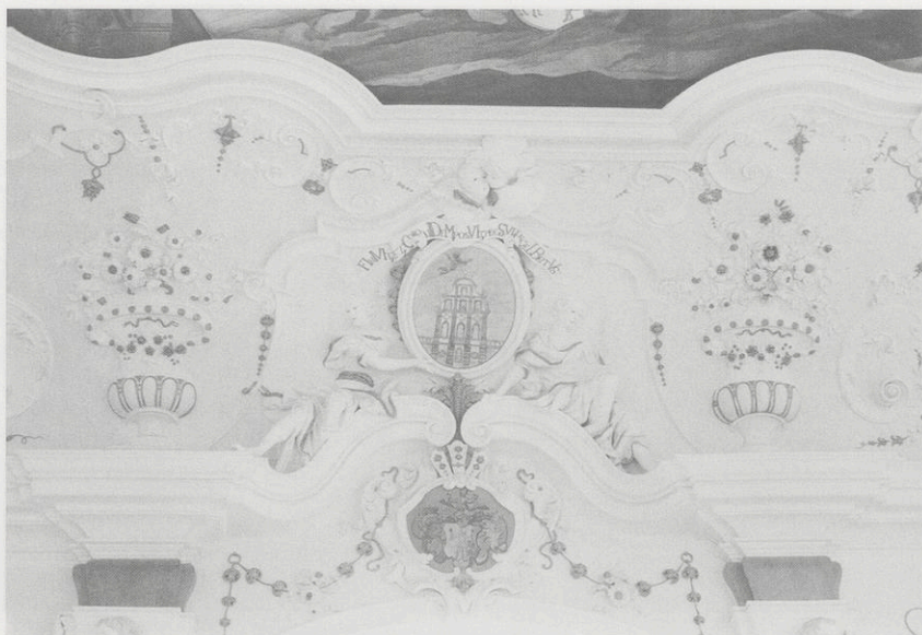
Abb. 9: Bronnbach, Sommersaal, Chronostichon auf die Fertigstellung des Saales durch Abt Engelbert Schöffner