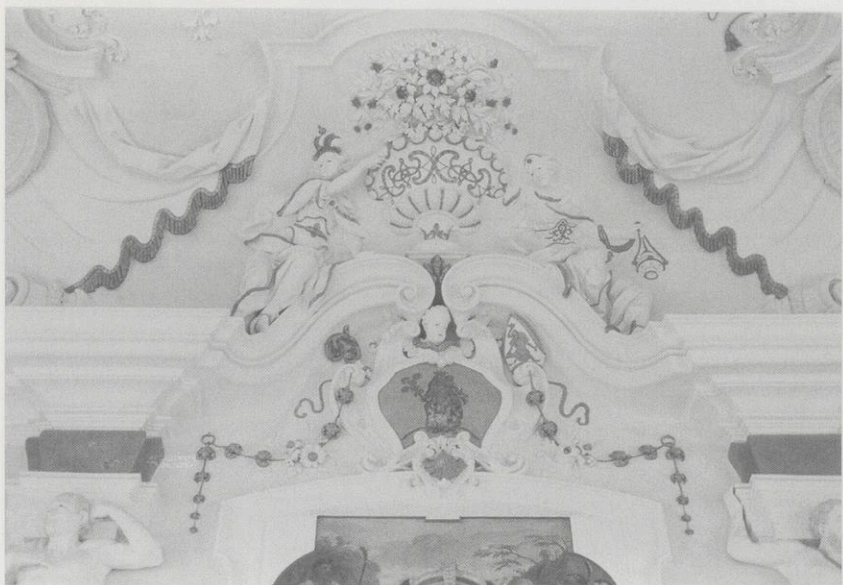
Abb. 10: Bronnbach, Sommersaal, Weltreicheallegorie im Deckenstück