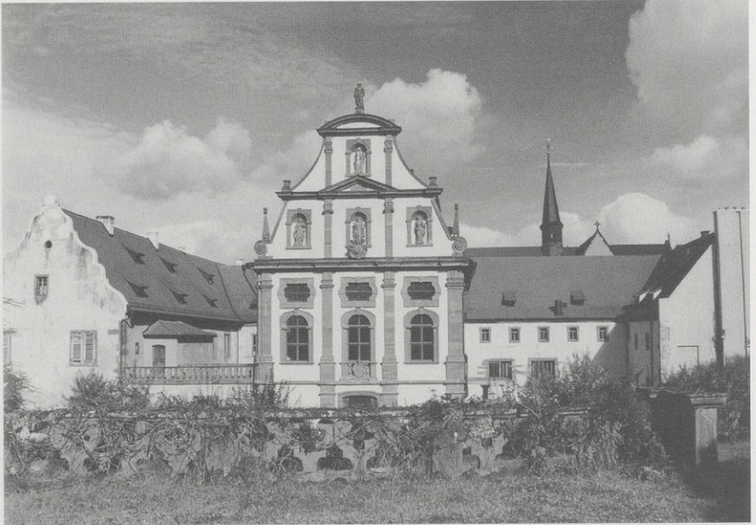
Abb. 5: Bronnbach, Sommersaal, Ansicht von Süden