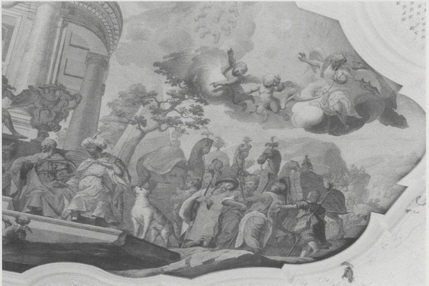
Abb. 14: Bronnbach, Sommersaal, Deckenbild, Ausschnitt