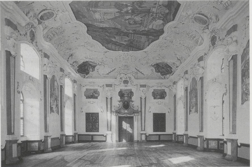
Abb. 6: Bronnbach, Sommersaal, Innenansicht