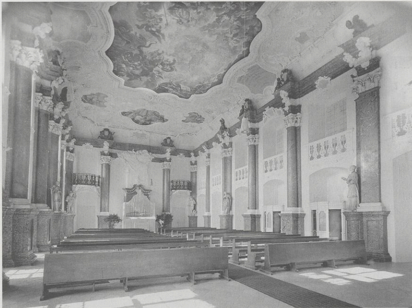
Abb. 4: Ebrach, ehem. Konventbau, Festsaal im 1. Obergeschoss