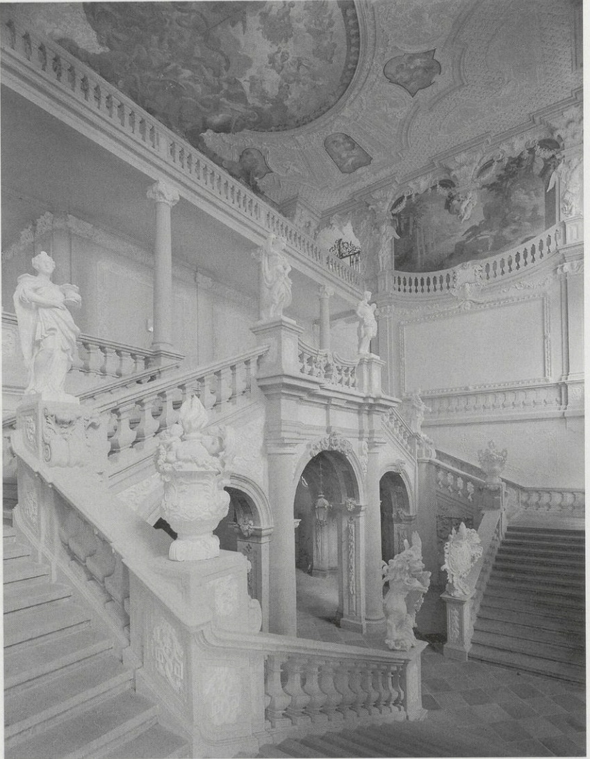
Abb. 2: Ebrach, ehem. Konventbau, Treppenhaus