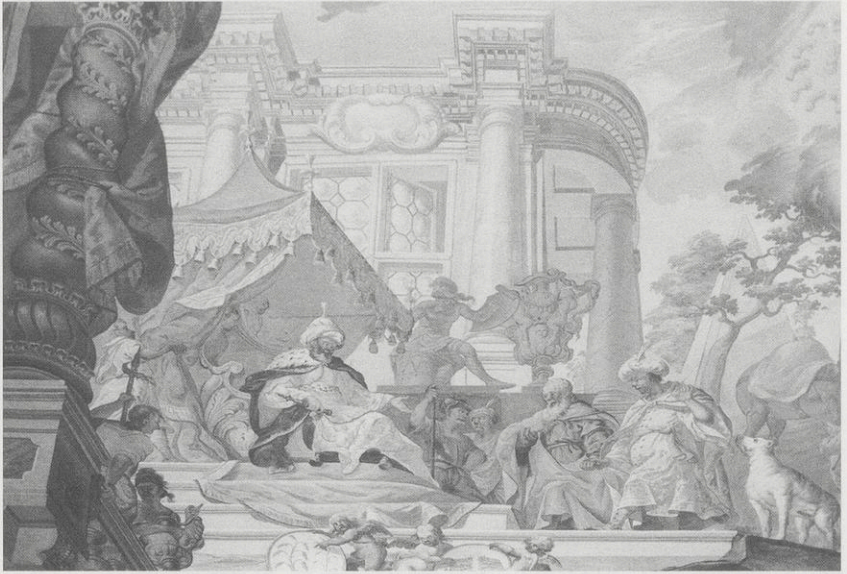
Abb. 13: Bronnbach, Sommersaal, Deckenbild, Ausschnitt