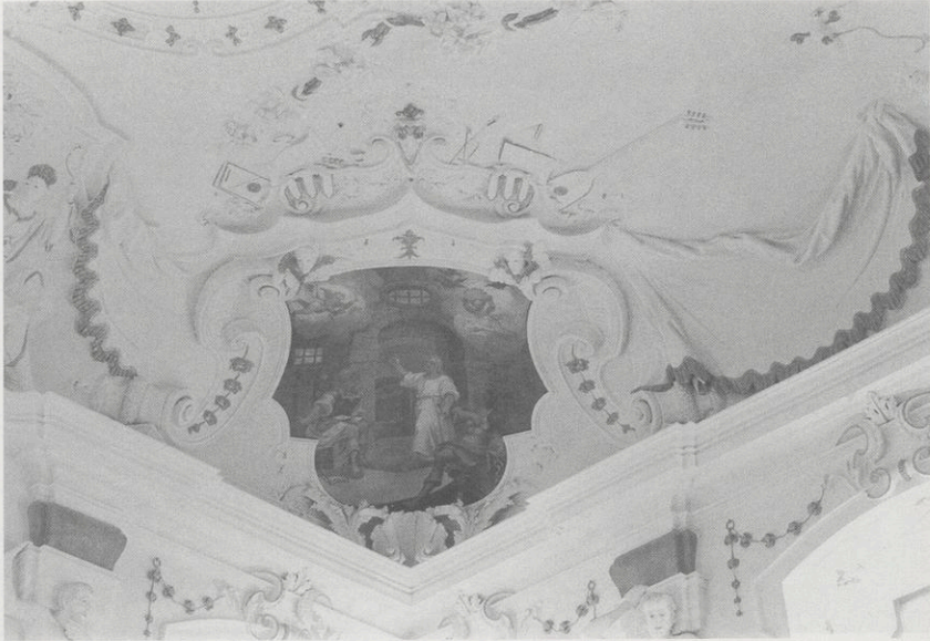
Abb. 11: Bronnbach, Sommersaal, Eckvoute