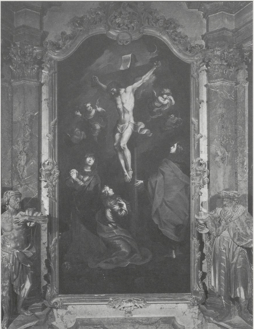
Abb. 3: Tobias Pock, Kreuzigung Christi, Altarblatt der Kreuzkapelle, 1675