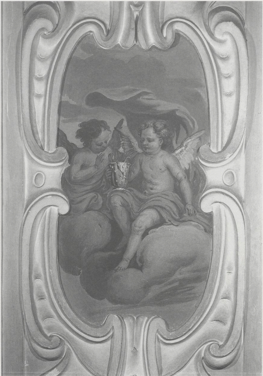
Abb. 5: Johann Bernhard Grabenberger, Zwei Putten mit zerbrochenem Giftbecher und Schlange als Attribut des hl. Ordensvaters Benedikt, Freskokartusche im östlichen Gewände der Benediktuskapelle