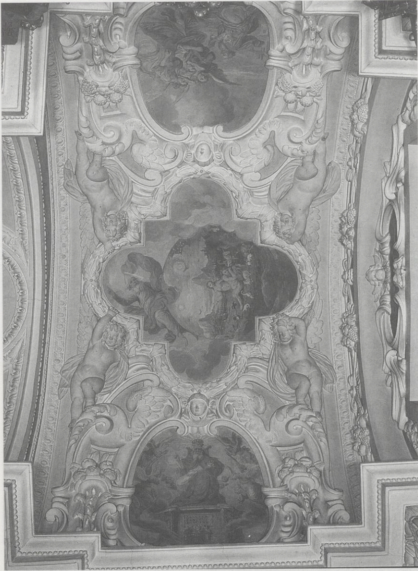
Abb. 2: Johann Bernhard Grabenberger, Stuckumrahmte Deckenfresken-Kartuschen der Trinitätskapelle: Ezechiels Himmelsvision, Erschaffung des ersten Menschenpaares und Philoxenie