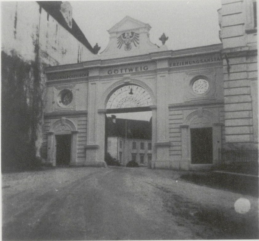
Abb. 3: Das für die Nationalpolitische Erziehungsanstalt (NPEA) Göttweig umgestaltete Südportal des Stiftes