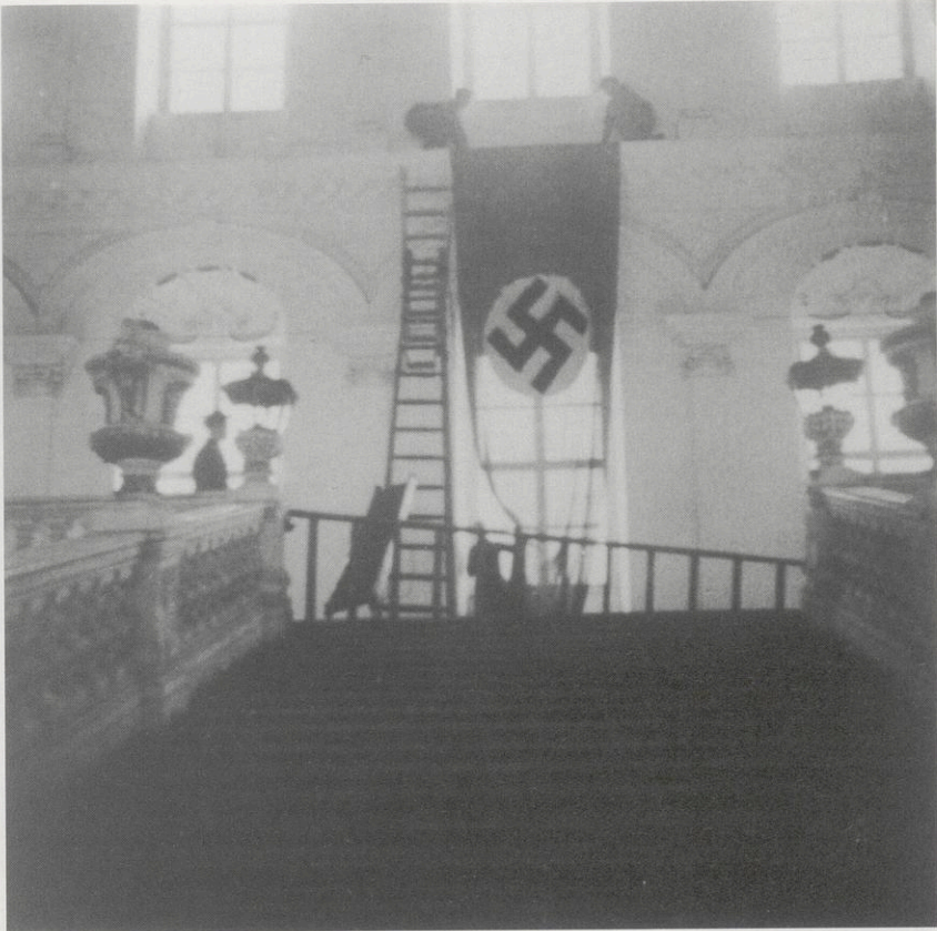
Abb. 1: Göttweiger Kaiserstiege: Hissen der Hakenkreuz-Fahne

Abb. 2: Grundrissplan für den Erweiterungsbau der Nöbelschule in Göttweig (1938/39)