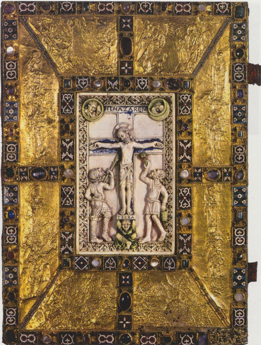
Abb. 1: Die Vorderseite vom Prunkeinband des „Codex Aureus“.