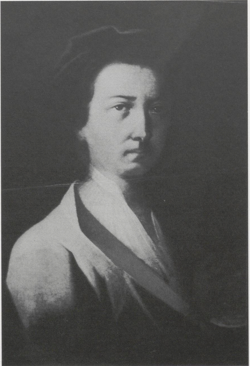
Das Selbstbildnis von Johann Ev. Holzer