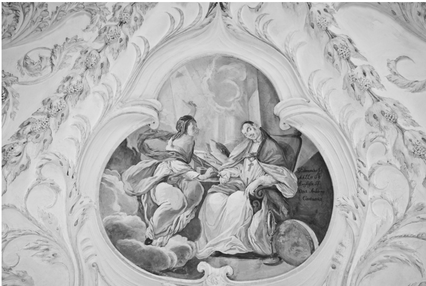
Abb. 4: Lilienfeld, Stiftsbibliothek, Edmund von Abington, 1704