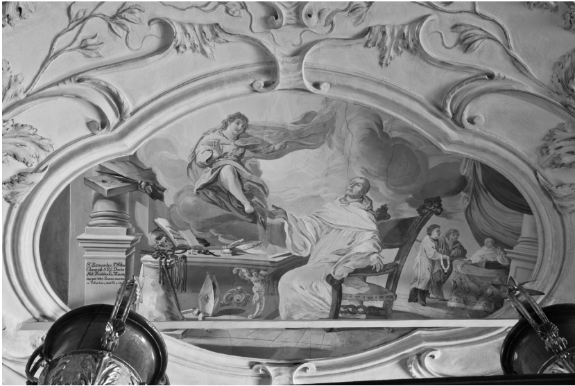
Abb. 3: Lilienfeld, Stiftsbibliothek, Bernhard von Clairvaux, 1704