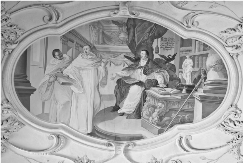
Abb. 6: Lilienfeld, Stiftsbibliothek, Otto von Freising, 1704