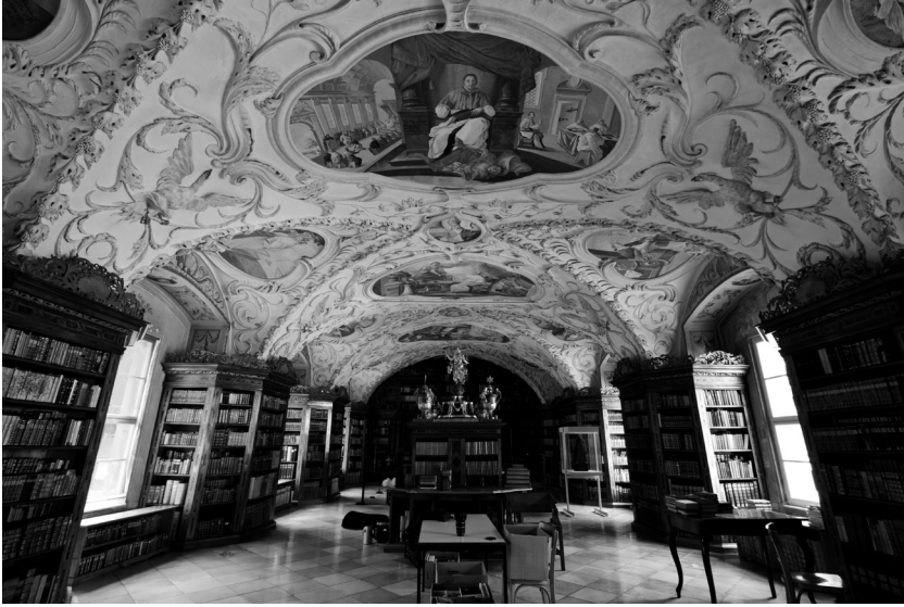
Abb. 1: Lilienfeld, Stiftsbibliothek, Gesamtansicht, 1704