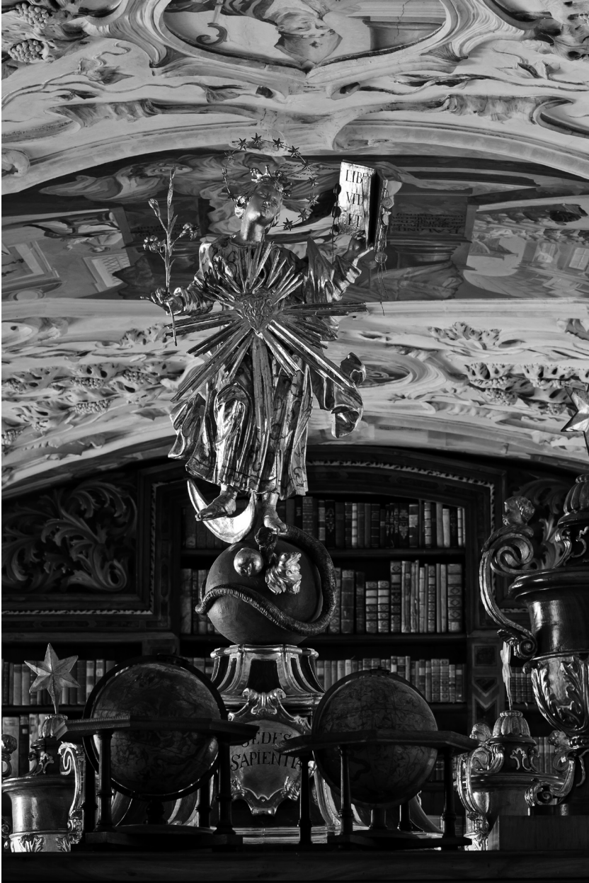
Abb. 8: Lilienfeld, Stiftsbibliothek, Immaculata-Statue im Zentrum des Bibliotheksraumes, 1701