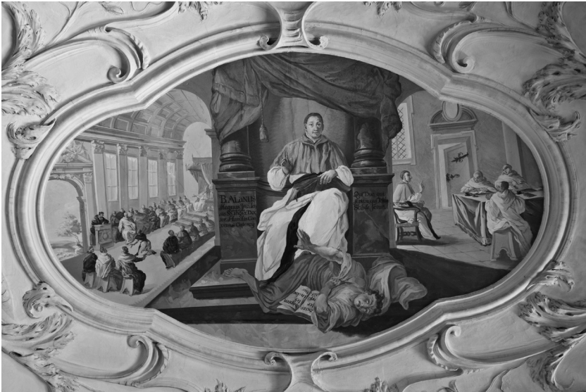
Abb. 2: Lilienfeld, Stiftsbibliothek, Alanus ab Insulis, 1704