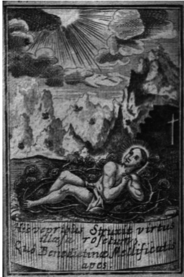
Abb. 1: „In diesen Dornen legte die unverletzte Tugend einen Rosengarten an, | In dem ihr benediktinischen Bienen Honig sammelt.“ – Der von Bienen umschwirrte junge hl. Benedikt im Dornstrauch auf dem Frontispiz von Pfaffenzellers „Apes Benedictinae“.

Ausgangspunkt seiner Predigt ist der seit jeher sprichwörtliche Bienenfleiß. Als Predigtmotto hat er deswegen Ps 87,16 der Vulgata gewählt: „ In laboribus à juventute mea. ... Ich bin arbeitsam von meiner Jugend auff “ 23 . Zu Beginn des ersten Predigtteils vertieft der Redner die Thematik durch weitere Bibelstellen. Nach Ijob 5,7 wird „ der Mensch ... geboren zur Arbeit/ und der Vogel zum flie-