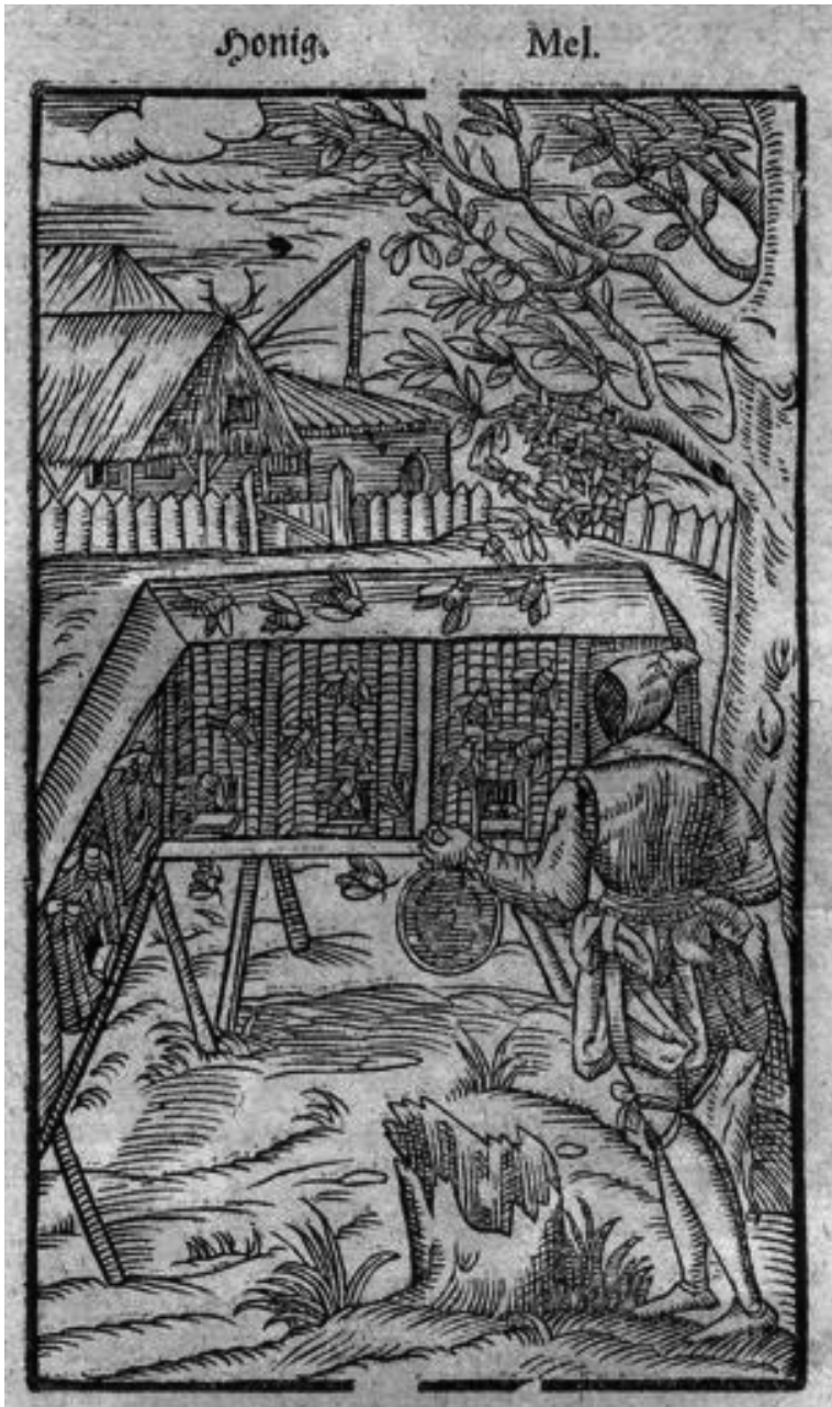
Abb. 2: Der Beckenschläger beim Schwarmfang – Holzschnitt aus Jakob Theodors (genannt „Tabernaemontanus“) „New vollkommen Kräuter-Buch“.