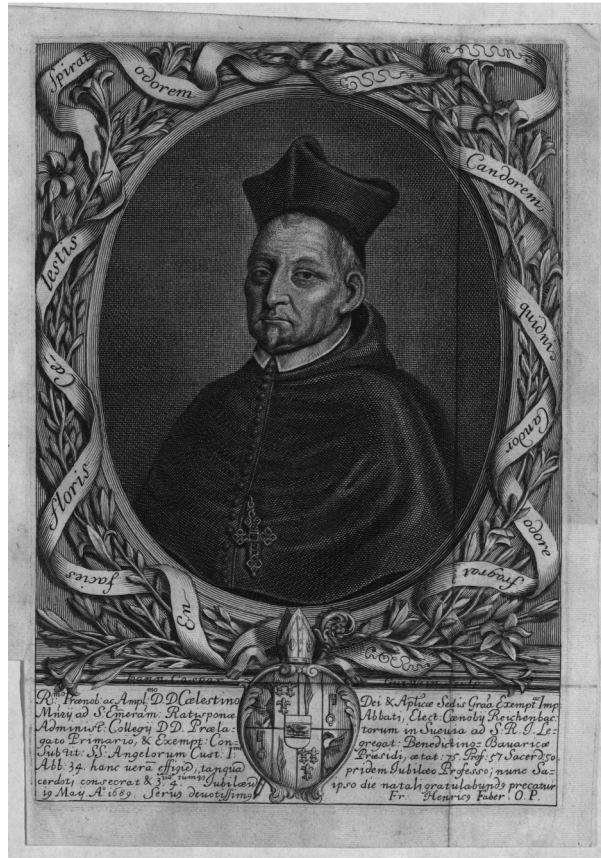
Abb. 1: Porträt des Abtes Coelestin Vogl von Sankt Emmeram aus dem Predigtdruck zu seiner Jubelprimiz 1689

den klösterlichen Leichenpredigten auf, zu denen es nun eine erste Gesamtdarstellung gibt 3 .