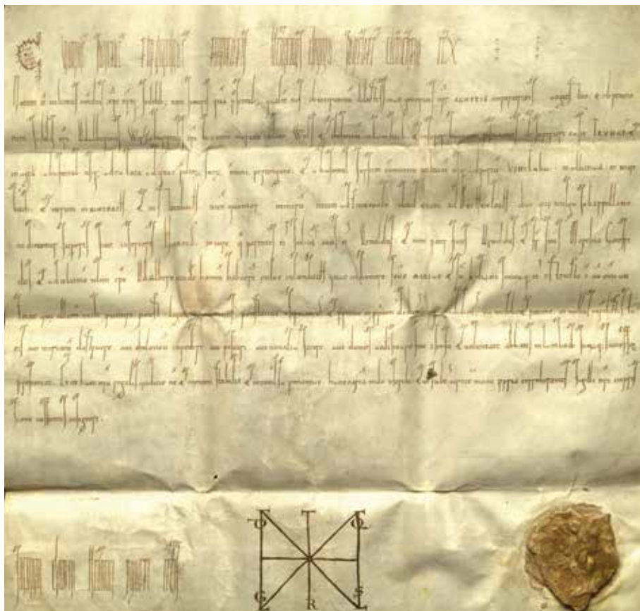
Stiftsarchiv Lambach, U 2 (Regensburg, 1061 II 18)

Auffallend sind ferner Veränderungen in der weltlichen testes -Reihe. Eingriffe finden sich aber auch anderweitig im Wortlaut und der Syntax, worauf an späterer Stelle zurückzukommen sein wird. Obwohl im Vergleich zur Lambacher Urkunde eine Datums- wie Indiktionsanzeige für den Episkopat Altmanns fehlt, ist auch die vatikanische Überlieferung nicht zeitgenössisch. Die Hand ist zweifellos für die zweite Hälfte des 12. Jahrhunderts, 20 also rund ein Jahrhundert nach den kodifizierten Rechtsvorgängen, anzusetzen. Die gleiche oder eine vergleichbare Hand hat auf fol. 12rv einen Brief von Papst Paschalis II. (1099–1118) an den Lambacher Abt Sigibold (1104–1116) aus dem Jahre