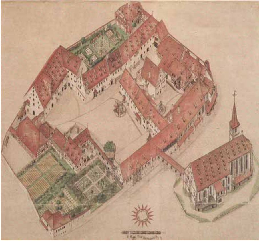
Abb. 2: Deutschordenskommande St. Jakob, Plan von Hans Bien (Germanisches Nationalmuseum Nürnberg)

benszeit dem Kleriker Konrad Bischof zu belassen. 38 Dabei handelte es sich um die Margarethenkapelle, nicht die darüber liegende Kaiserkapelle, in der Kaiserpfalz. 39 Im August dieses Jahres übereignete der König in Nürnberg dem Orden nochmals die Jakobskirche und alles Zubehör. 40 Die als Vorurkunden verwendeten Schenkungen Ottos IV. werden nicht erwähnt. Im Dezember