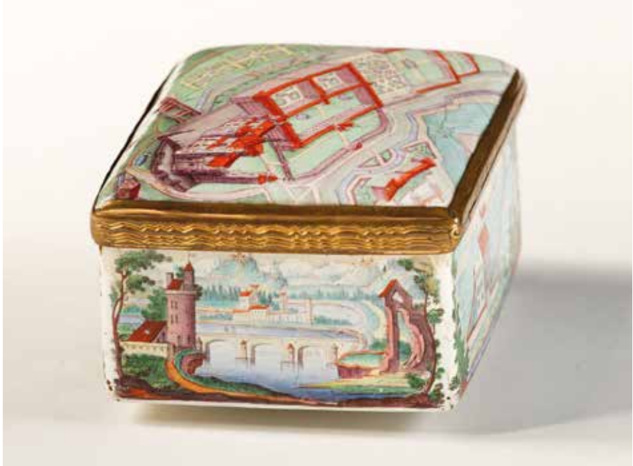
Abb. 7: Tabatiere, rechte Schmalseite (Wien-Museum, Wien)

nach den herangezogenen Beispielen zu urteilen, malt und koloriert Bechdolff jedoch weniger expressiv als der Autor der Ottobeurer Dose und teilt sich die Malfläche besser ein.