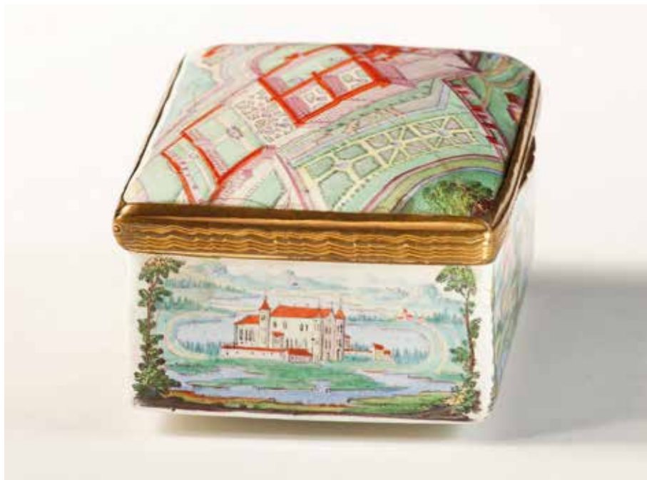
Abb. 6: Tabatiere, linke Schmalseite (Wien-Museum, Wien)

abbildet, noch die rechte Seite, auf der verschiedene Bauten um einen See gruppiert sind, weckt Erinnerungen an Orte, die – so, wie Stein und Erkheim – mit der Besitzgeschichte des Reichsstiftes verbunden sind. Auch wenn das Element Wasser in den Ansichten dominiert, können die Ottobeurer Güter am Bodensee, das Weingut in Sipplingen und der Pflughof in Immenstaad, ausgeschlossen werden. Feldkirch (Vorarlberg, Österreich), wo Ottobeuren ein Priorat unterhielt, scheidet ebenso aus.