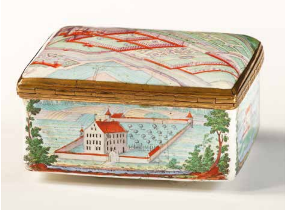
Abb. 5: Tabatiere, hintere Langseite: Schloss Erkheim (Wien-Museum, Wien)

Westfront im zweiten Obergeschoss betont, wirkt herrschaftlich. Als Gliederung sind aufgemalte oder erhabene Rustika an den Hausecken und Dreiecksgiebel über den Fenstern angedeutet.