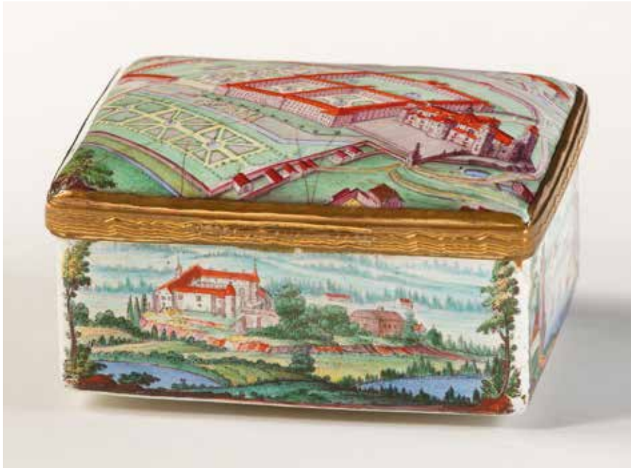
Abb. 3: Tabatiere, vordere Langseite: Schloss Stein (Wien-Museum, Wien)