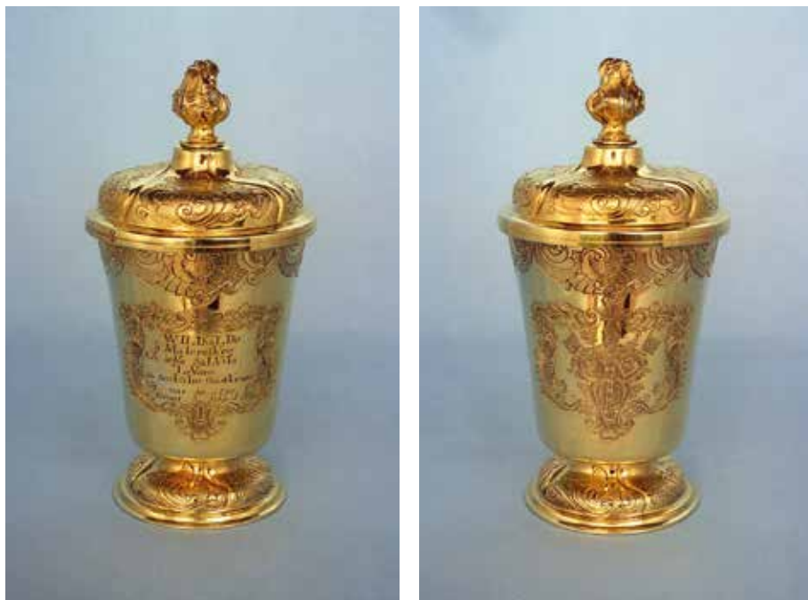
Abb. 10-11: Vorder- und Rückansicht des Taufbechers (Dr. Eva Toepfer, Bech-Kleinmacher, Luxemburg)

das Wappen des hl. Theodor, für den Konvent. In dem großen Dreischildwappen darunter sind Stifts- und Konventwappen mit dem persönlichen Wappen des 1751 amtierenden Abtes Anselm Erb – in Blau ein silberner, goldgefasser Pfahl mit drei roten, sechs Zackigen Sternen – kombiniert.