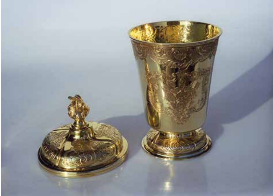
Abb. 9: Taufbecher mit Ottobeurer Wappen (Dr. Eva Toepfer, Bech-Kleinmacher, Luxemburg)

VVILibaLDo à MaIersbVrg eX aqVa saLVtIs LeVato Ab AntIstIte OttobVrano nat. 10. Apr. Denat. 5. Febr. A. Seq. 49