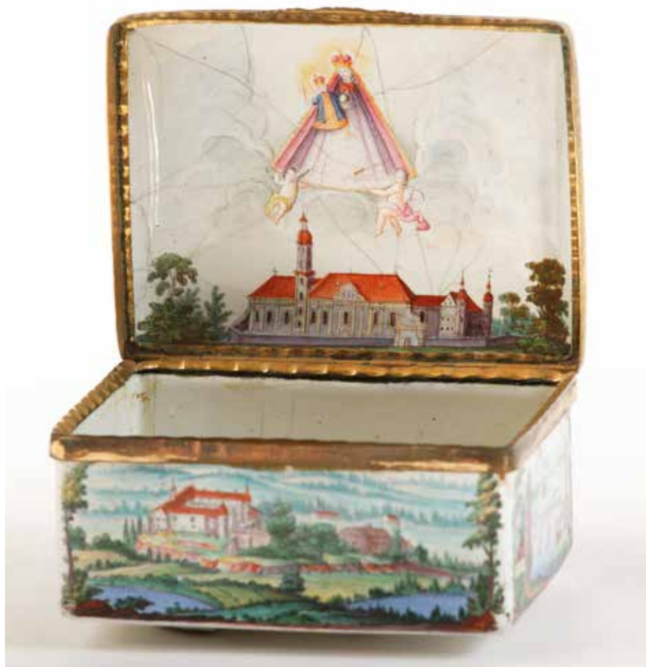
Abb. 2: Tabatiere, Deckelinnenseite mit Darstellung des Superiorats Eldern (Wien-Museum, Wien)

rigkeiten. Um wieviel besser meisterte dagegen Thiébaud seine Aufgabe, als er die Vogelschau der Ottobeurer Klosteranlage von dem weiter oben schon erwähnten, 408 mm x 407 mm großen Klauber-Stich gut proportioniert für die kreisrunde Fläche der Jubiläumsmedaille von 1766 miniaturisierte.