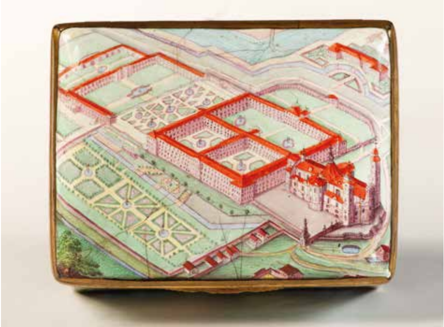
Abb. 1: Tabatiere, Deckelaußenseite mit Vogelschau der Ottobeurer Klosteranlage (Wien-Museum, Wien)

Abgesehen von der freien künstlerischen Farbgebung lässt die Darstellung Schwächen in der Einteilung der Malfläche erkennen: Die Süd-Ost-Ecke des Ökonomiegebäudes ist angeschnitten, das Beamtengebäude aus der Ost-West-Achse gerückt, der Ziegelei-Bau in die obere rechte Ecke hineingepresst; und der Schwerpunkt der Vogelschau hat sich so stark in die rechte Bildhälfte verschoben, dass der westliche Fassadenturm der Klosterkirche beinahe die Metallfassung berührt. Für die aufgezählten Mängel wächst jedoch das Verständnis, wenn man die Vorlage für die perspektivische Ansicht kennt.