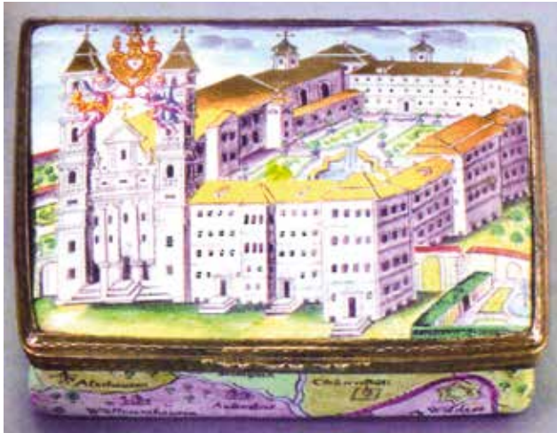
Abb. 8: Emailldose mit Ansicht von Kloster Weißenau (Galerie Neuse, Bremen)

Vielmehr dürfte Piazol die Dose zum Geschenk erhalten haben, z.B. von seinem Konvent. 42