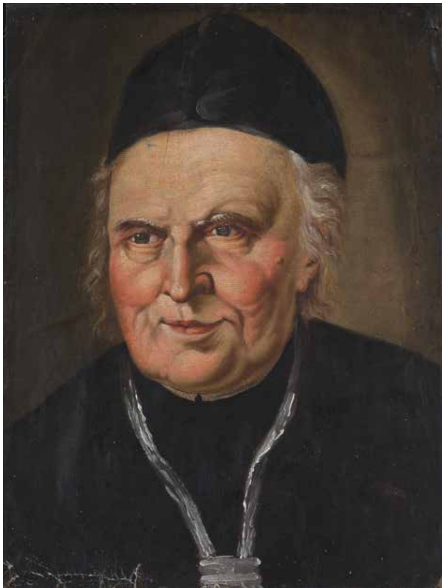
Abb. 1: Porträt von Ollegarius Seidl, Ölgemälde, 40,5 x 30,8 cm, Maler unbekannt, 2. Hälfte 18. Jahrhundert; Leihgabe der Pfarrkirchenstiftung im Museum Polling