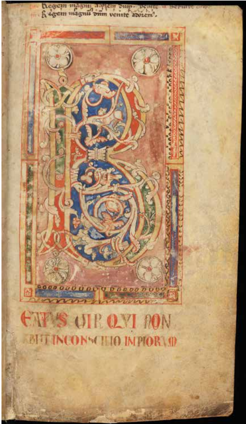
Abb. 5: Breviarium, Stiftsbibliothek St. Gallen, Cod. Sang 403, p. 15.