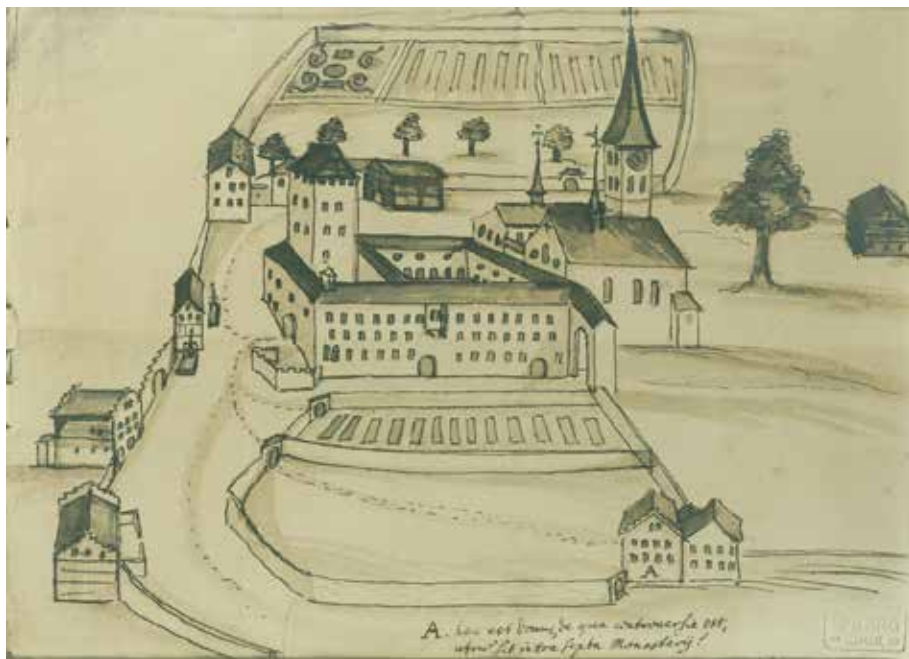
Abb. 1: Zeichnung des mittelalterlichen Klosters Disentis von 1685 (Klosterarchiv Disentis).

lichen Gottesdienst, die Eucharistiefeier und das Chorgebet, schrieben die Mönche in ihren Skriptorien liturgische Bücher: Missale, Antiphonare, Graduale, Epistolare und Evangeliare. Zur lectio neben der Bibel gehörten in den karolingischen Klöstern auch die griechischen und lateinischen Kirchenväter und Theologen des frühen Christentums. Für die Schulen der Klöster, in welchen die Artes liberales gelehrt wurden, entstanden Handschriften profaner Wissenschaften. So wuchs die Zahl der Handschriften in den Klöstern ständig. Der älteste, zwischen 860 und 865 entstandene Katalog des Klosters St. Gallen verzeichnet insgesamt 426 Titel. Im Kloster auf der Reichenau lag der Handschriftenbestand im Jahre 821 bei 415 Bänden. 5