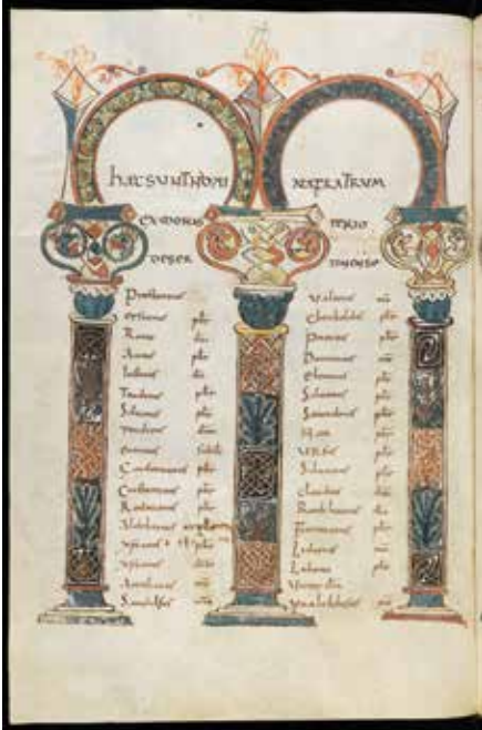
Abb. 2: Stiftsarchiv St. Gallen (Abtei Pfäfers), Cod. Fab. 1, Evangelistar (Liber viventium), p. 74.

die Regel des hl. Benedikt erhielten. 7 Das aufblühende Kloster zog viele Mönche an. Aus dem Reichenauer Verbrüderungsbuch von 810 erfahren wir, dass unter den Äbten Ursicinus und Agnellus von ca. 750–810 nicht weniger als 164 Mönche lebten. 8 Nach dem Liber Viventium Fabariensis 9 , einer Handschrift im Kloster Pfäfers aus dem 9. Jahrhundert, umfasste der Mönchskonvent von Disentis unter Abt Praestantius in der zweiten Hälfte des 9. Jahrhunderts 63 Mönche: 24 Priester, 10 Diakone, vier Subdiakone und 25 Laienmönche, 10 Wegen der grossen Zahl der Priestermonche errichtete das Kloster für den Gottesdienst neben der Marienkirche und der Petruskapelle eine neue grosse Klosterkirche mit drei umfangreichen Apsiden, deren Grundmauern heute noch im Klosterhof erhalten sind. In diese Klosterkirche wurde die Krypta der ersten Martinskirche als Westkrypta eingebaut. 11 Die Schenkungsurkunde des Churer Bischofs Tello von 765, das sogenannte Tello-Testament, nennt für das Kloster Disentis drei Kirchen: St. Maria, St. Martin und St. Petrus. 12 Im karolingischen Disentis entwickelte sich ein blühendes monastisches und liturgisches Leben. Im Skriptorium entstanden wertvolle, reich illuminierte liturgi-